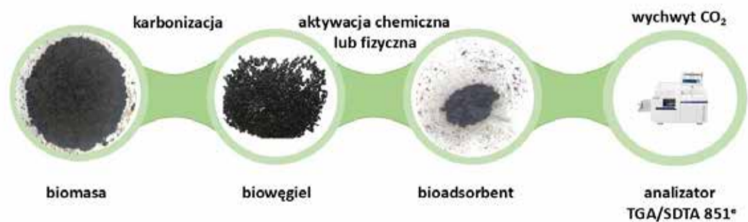
Rys.3 Schematyczny przebieg otrzymywania bioadsorbentu z biomasy do wychwytu CO 2 : biomasa → karbonizacja → biowęgiel → aktywacja chemiczna lub fizyczna → bioadsorbent → pomiar zdolności sorpcyjnej przy użyciu analizatora TGA/SDTA 851e (opracowanie własne)