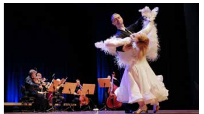
W galerii zdjęć obok: wręczenie Nagród im. Wł. Biegańskiego w Filharmonii Częstochowskiej 9 kwietnia 2026