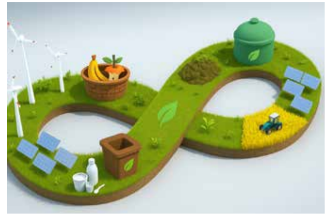
Rys. 1 Bioodpady jako element gospodarki obiegu zamkniętego (grafika wygenerowana przy użyciu sztucznej inteligencji)