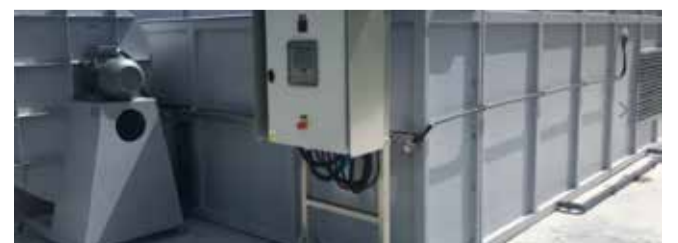
Rys. 2. Różne typy biofiltrów: biofiltr otwarty ( https://www.compost-systems.com/pl/products/systems-technology/systemy-odprowadzania-powietrza ) oraz biofiltr zamknięty kontenerowy ( https://www.ekofinn.pl/produkty/oczyszczanie-powietrza/system-carbowent )