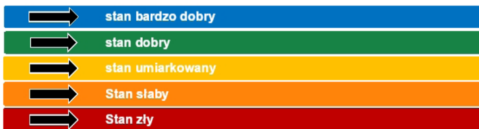
Rys. 1. Klasyfikacja jakości wód powierzchniowych, opracowanie własne na podstawie [3].

Zgodnie z Rozporządzeniem Ministra Infrastruktury, stan jakościowy wód powierzchniowych może być oceniany na pięć stopni. Od stanu bardzo dobrego, gdzie rzeki są w doskonałej kondycji, po stan zły, który oznacza poważne zakłócenia i zmiany w ekosystemie rzeczonym.