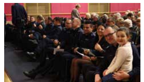
w galerii - zdjęcia z rozdania nagród w konkursie na „Najlepszego Dzielnicowego” (fot. Łukasz Stacherczak, UM).