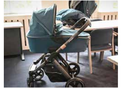
Informacja z Wydziału Zdrowia UM