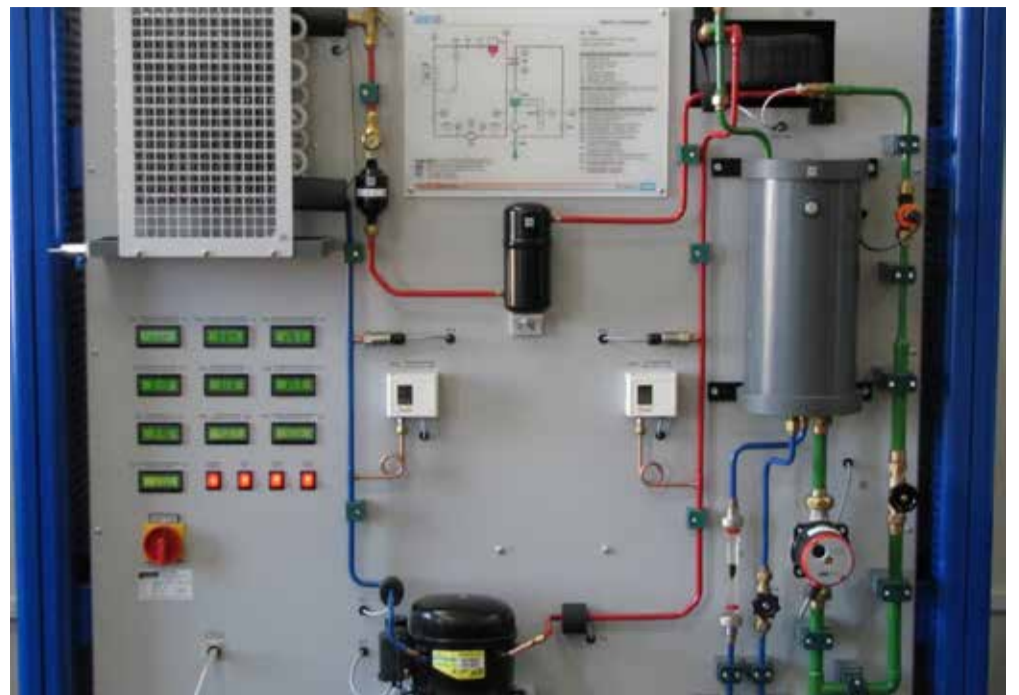
Fot. 2. Stanowisko laboratoryjne pompy ciepła na Wydziale Infrastruktury i Środowiska Politechniki Częstochowskiej

częściej w ciągu całego roku). Innymi słowy - gdy współczynnik COP = 3, wówczas na każdy 1kW pobranej energii elektrycznej, zużywanej na zasilanie pompy, 2kW energii zostanie pobrane z powietrza, gruntu lub wody, dając ostatecznie 3kW ciepła. Jednakże współczynnik COP podawany jest dla konkretnych warunków, w których prowadzi się pomiar (np. temperatury powietrza zewnętrznego wynoszącej 7°C i temperatury ogrzewania podłogowego 35°C). W rzeczywistości temperatura zewnętrzna jest zmienna. Dlatego też wprowadzono współczynnik SCOP, uwzględniający zmianę temperatury oraz strefę klimatyczną, w której będzie pracować dane urządzenie. W celu określenia efektywności energetycznej pomp ciepła, zgodnie z Rozporządzeniem UE 2, stosuje się oznaczenia w postaci etykiet. Fotografia 1 przedstawia etykietę niskotemperaturowej pompy ciepła określającą znamionową moc cieplną w kW w warunkach klimatu umiarkowanego, chłodnego i ciepłego