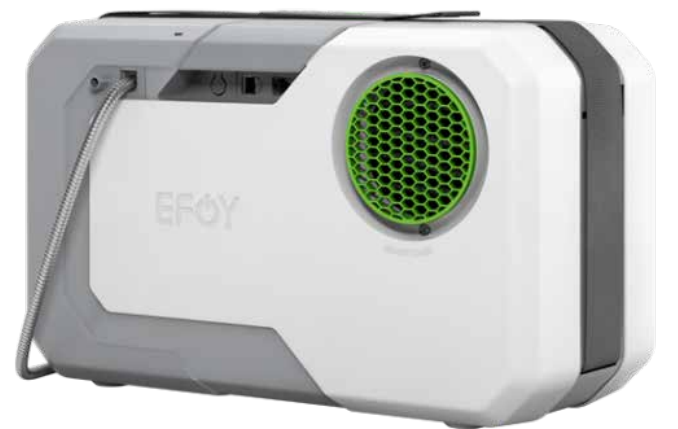
Rys. 2. Ogniwo paliwowe EFOY 80 BT.