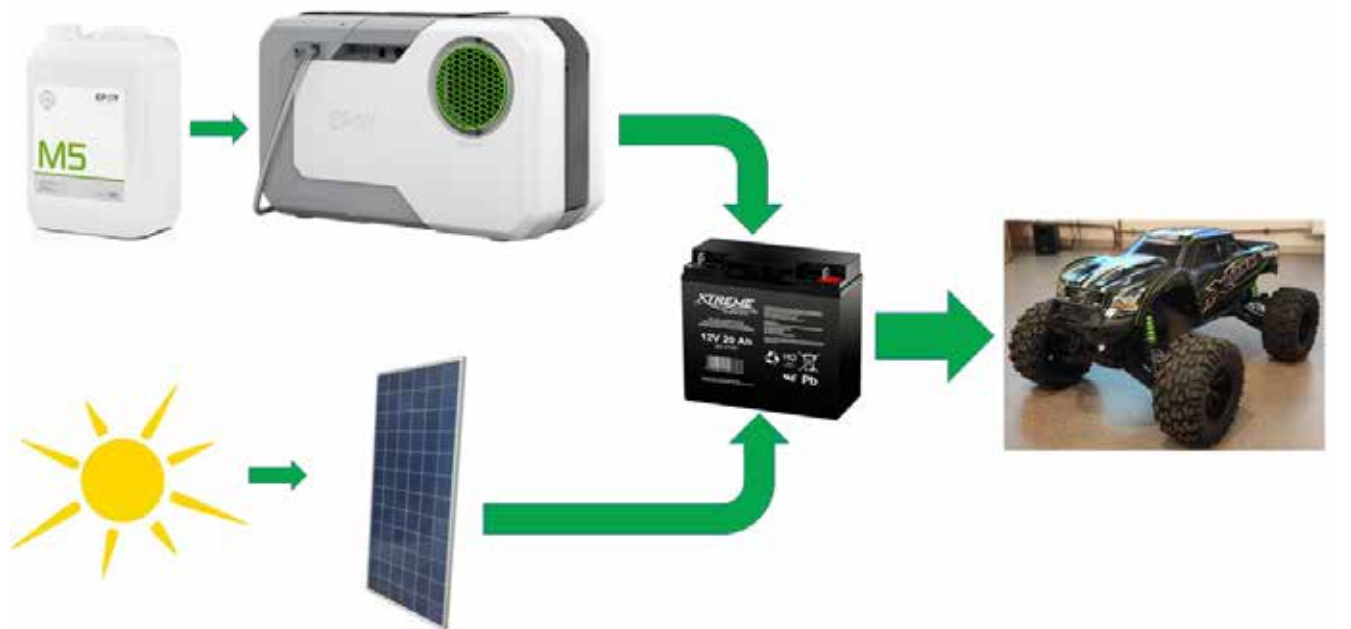
Rys. 3. Schemat połączeń głównych elementów mobilnej stacji ładowania samochodu elektrycznego.