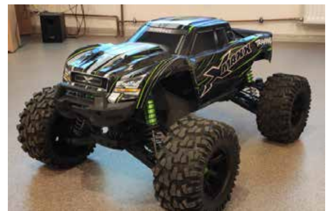
Rys. 1. Modelowy samochód elektryczny.