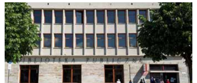
na zdjęciu: budynek Wypożyczalni Głównej od zewnątrz

realizacji tego samego zadania Budżetu Obywatelskiego (zadania nr 555 poprzedniej edycji). Wymieniono więc tam meble, elementem wystroju placówki jest neon na ścianie, są nowe rolety. Jest nowy sprzęt muzyczny. Dla potrzeb Muzoteki zakupiono też nowe zbiory – książki, nuty, płyty CD i płyty analogowe.