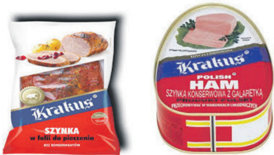
Fot. 1. Szynka Krakus w folii do pieczenia.

Przeszłością jest pogląd, że najważniejszym jego zadaniem jest ochrona produktów przed niekorzystnymi czynnikami zewnętrznymi. Dziś funkcja opakowania jest znacznie szersza. Umiejętne projektowanie opakowań stanowi gwarancję, że dany produkt będzie wyróżniał się spośród innych, nieraz podobnych, a to, w jaki sposób prezentuje się na sklepowej półce, często decyduje o wyborze danej marki.