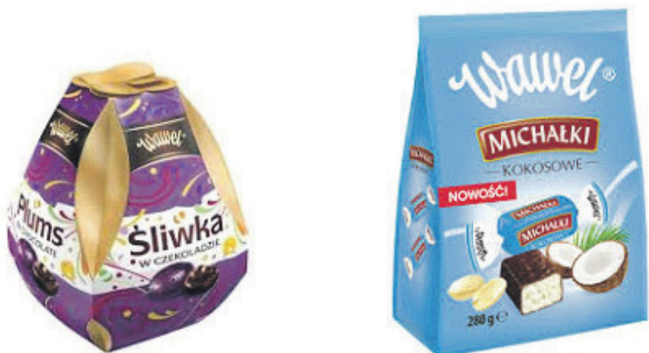
Fot. 2. Cukierki w czekoladzie- Wawel.

Projektowanie opakowań jest istotnym elementem polityki produktu i najlepszym narzędziem komunikacji z potencjalnym nabywcą. „Opakowanie jest obecnie jednym z najtańszych narzędzi reklamy. Można nawet zaryzykować stwierdzenie, że jest ono prawie bezpłatne”. Opakowanie, aby było efektywne, musi być planowane razem z produktem. W projekcie opakowania należy uwzględnić wyniki przeprowadzonych badań dostosowując je do preferencji i oczekiwań klienta. „Opakowanie pełni szereg funkcji, spośród których funkcja marketingowa i sprzedażowa decydują o atrakcyjności wizualnej produktu, jego przydatności w aranżacji półek i witryn sklepowych oraz organizacji akcji promocyjnych. Dlatego nowoczesne opakowanie powinno być zaprojektowane w taki sposób aby było atrakcyjne dla nabywcy i długookresowo pomagało budować lojalność wobec marki. Wiąże się to z przestrzeganiem pewnych reguł odnoszących się do jego wielkości kształtu, kolorystyki i innych elementów. Projektowanie i wybór optymalnych opakowań przynosi korzyści nie tylko producentom, hurtownikom i detalistom, ale również konsumentom”.