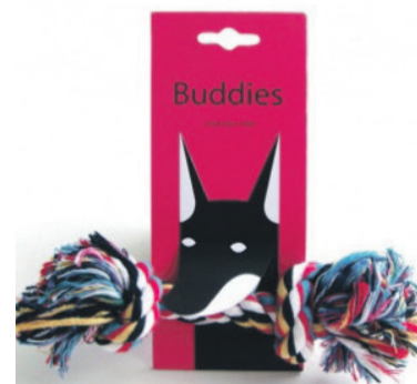
Fot. 4. Oryginalne opakowania- zabawki dla dzieci.

Produkt jest konstruktem społecznym. Firma dbając o wizerunek produktu dba jednocześnie o relacje z klientem. Opakowania są częścią wyobraźni konsumentów. Produkt zostaje zapamiętany w pierwszej fazie zakupu ze względu na funkcjonalność opakowania i jego wizerunek. Dobrze zapamiętany produkt to dobrze zapamiętana firma.