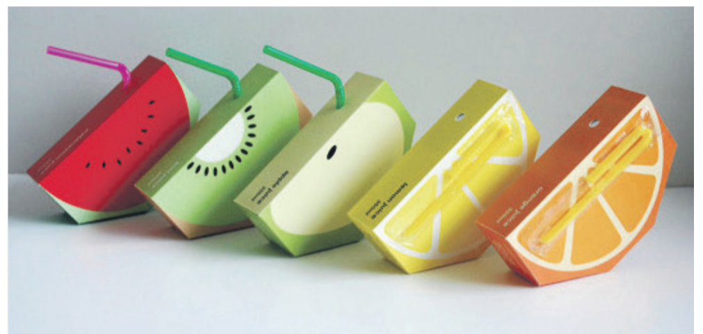
Fot. 3. Oryginalne opakowania- soki owocowe.

Kolor jest integralną częścią projektu opakowania i przyczynia się do jego efektywności i poprawia jego zdolność sprzedażową. Przyciąga uwagę klienta, ułatwia identyfikację z marką, podkreśla estetyczność i atrakcyjność.