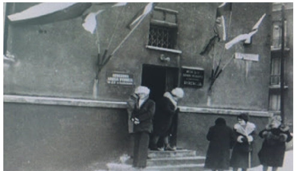
Foto: Siedziba przedsiębiorstwa przy ul. Braci Domagalskich