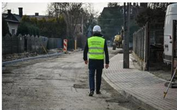
Śląskie. Utrudnienia drogowe w Częstochowie mają potrwać około 6 tygodni.