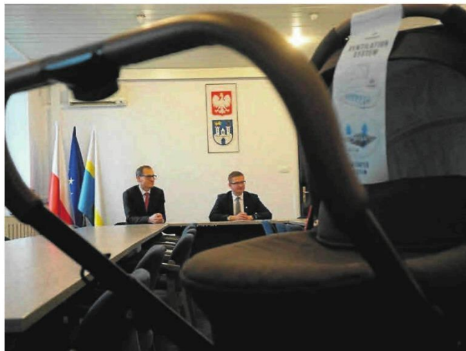
Każde dziecko urodzone w programie in vitro otrzymuje wózek od firmy Deltim