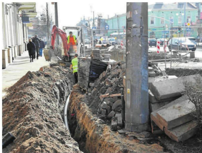
Zamknięcie alei NMP spowoduje znaczne utrudnienia w centrum Częstochowy