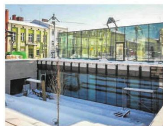
Przed pawilonem wybudowano schody. Będzie tu można organizować m.in. koncerty