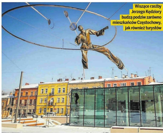
Wiszące rzeźby Jerzego Kędziory budzą podziw zarówno mieszkańców Częstochowy, jak również turystów