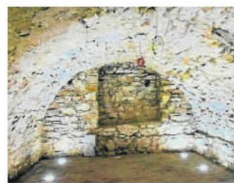
Wnętra idealnie nadają się do prezentacji eksponatów związanych z odległą historią