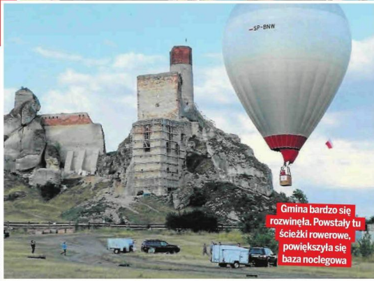
Gmina bardzo się rozwinęła. Powstały tu ścieżki rowerowe, powiększyła się baza noclegowa

to dziejowa powinność i historyczna sprawiedliwość.