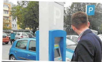
W strefie płatnego parkowania zostaną także wymienione parkomaty. To kolejna, ważna informacja dla mieszkańców

kańców, bo urządzenia są już dość przestarzałe, a jedną z ich wad jest brak możliwości płatności kartą, co w innych miastach jest standardem. Strefa została powiększona o 16 dodatkowych obszarów: aleja Jana Pawła II (od Szajnowicza-Iwanowa do Rynku Wieluńskiego), aleja Wolności (od ul. Jana III Sobieskiego do Ronda Mickiewicza), ul. Dunkowskiego, ul. Kilińskiego (od Chłopiczkiego do Zbierskiego), ul. Klasztorna (od 7 Kamienic do Kardynała Stefana Wyszyńskiego), ul. Kordeckiego (od 7 Kamienic