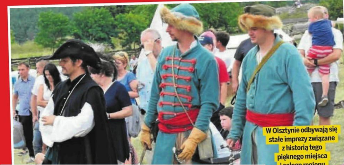
W Olsztynie odbywają się stale imprezy związane z historią tego pięknego miejsca i całego regionu

W 1928 roku wyłączona została jeszcze osada Mirów, która stała się częścią miasta Częstochowa. Po wojnie przywrócono przedwojenny podział administracyjny. Dziś Olsztyn spełnia wszystkie kryteria obowiązujące przy nadawaniu lub przywróceniu praw miejskich, dlatego warto podjąć takie działania. Po 150 latach