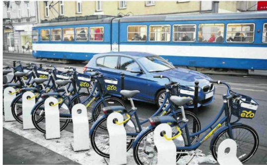
• Rowery nadal będą darmowe lub bardzo tanie. Obecnie w większości miast nie trzeba płać za pierwsze 20 minut lub pierwsze pół godziny.

Na wyłonienie operatora czekają też m.in. Gliwice. Jeśli się to szybko uda, rowery ruszą w tym mieście w maju. Takie same plany ma Rzeszów, który w zeszłym roku nie uruchomił rowerów w ogóle, tłumacząc się pandemią. Ratusz stwierdził, że nie było możliwości ich odkażania.