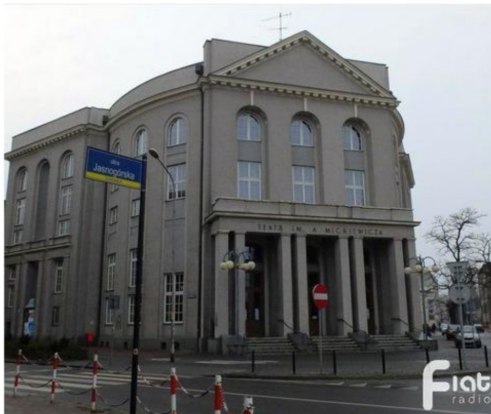
Teatr im. Adama Mickiewicza w Częstochowie

Jeśli interesuje cię sztuka, jesteś magistrem i masz dryg do zarządzania, spróbuj swoich sił w konkursie na stanowisko dyrektorskie Teatru im. Adama Mickiewicza w Częstochowie. Dokumenty należy składać do 31 marca bieżącego roku.