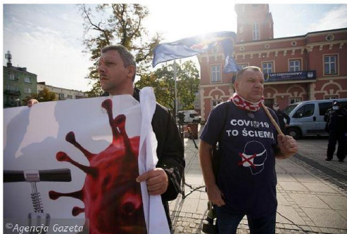
Częstochowa, pl. Biegańskiego, 10 października 2020 r. Marsz o wolność zorganizowany w proteście wobec ograniczeń związanych z epidemią koronawirusa.

odbyć z zastosowaniem obostrzeń związanych z pandemią koronawirusa. Jednak zebrani na pl. Biegańskiego w większości nie mieli zasłoniętych ust i nosów. Za to mieli m.in. hasła o rządzie, „co fałszywą pandemią rujnuje Polskę” i że „pandemia to ściema, dość tresury maseczkowej”.