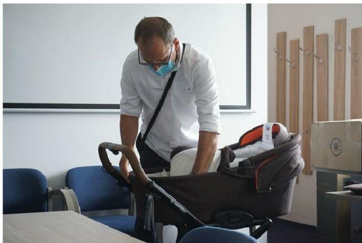
Wózek z firmy Deltim przekazany rodzicom dziewczynki urodzonej dzięki miejskiemu programowi in vitro

Obecnie uczestnikom programu przysługuje możliwość jednorazowego dofinansowania do zabiegu zapłodnienia pozaustrojowego w wysokości do 5 tys. zł pod warunkiem przeprowadzenia jednej procedury. Pozostałe koszty ponoszą pary.