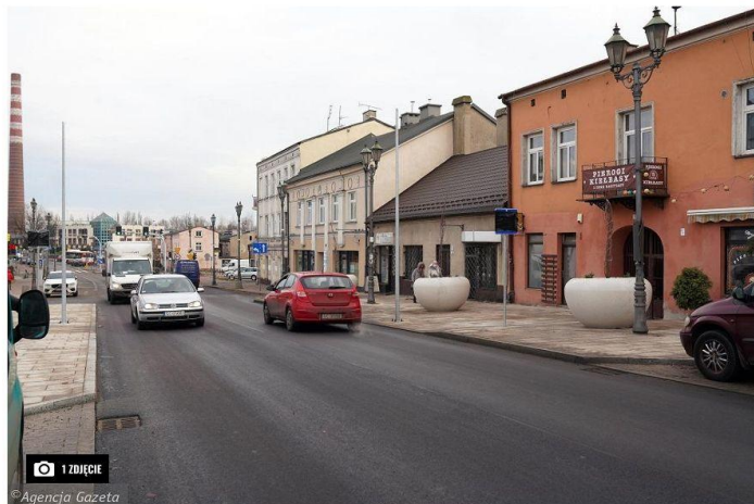
Agencja Gazeta Częstochowa, ul. Mirowska, 7 grudnia 2020 r.

Przebudowa al. Wojska Polskiego oraz modernizacja Głównej i Przejazdowej wraz z budową obejścia ul. św. Barbary to najważniejsze inwestycje drogowe w tym roku w Częstochowie. Nie będą natomiast jedyne, drogowcy mają całkiem spore plany.