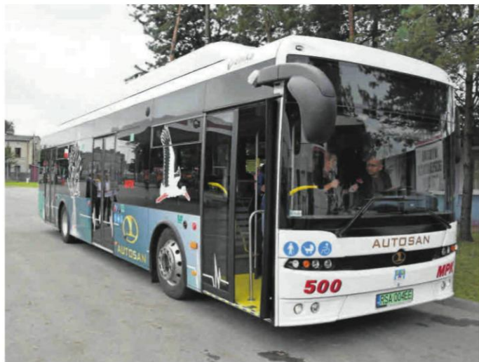
Dzięki otrzymanej dotacji miasto zakupi cztery autobusy elektryczne