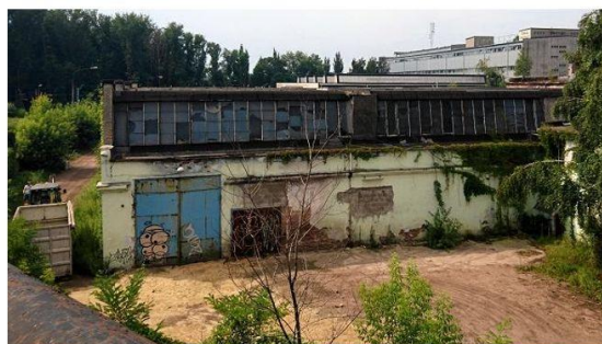
Hala dawnego Wełnopolu, gdzie odkryto niebezpieczne odpady