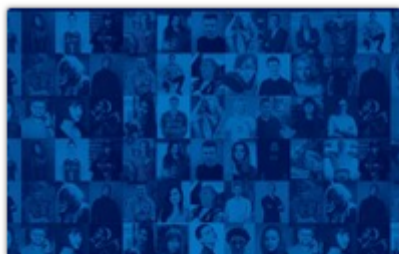
fol. UM Częstochowy

Miejski projekt „Twarze Przyszłości” był jednym z elementów zeszłorocznemu jubileuszowi 800-lecia pierwszej historycznej wzmianki o naszym mieście. Poznaliśmy 88 młodych osób, które z racji swoich osiągnięć już mogą uchodzić za „ambasadorów Częstochowy”.