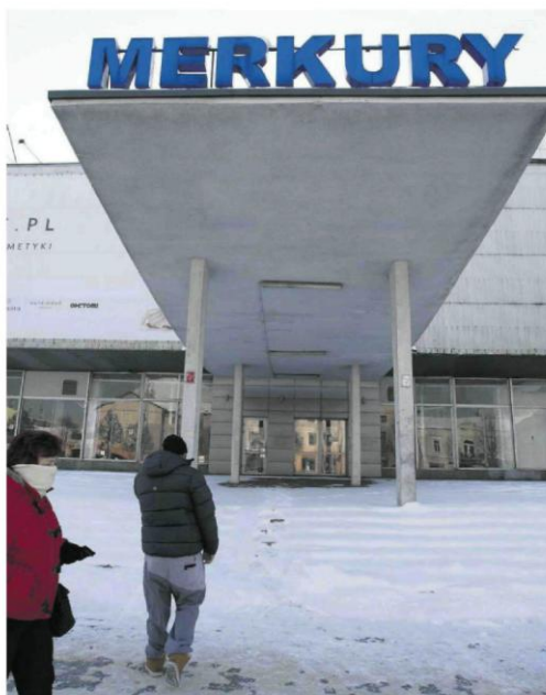
• Wejście do nieczynnego od lat Merkurego wciąż zdobi szczyt.

Po transformacji ustrojowej Merkurego przejęła spółka pracownicza. Część powierzchni na najniższej kondygnacji wynajęto sieci Leader Price, którą w 2007 r. kupiło Tesco. Spółka pracownicza przeliczyła się jednak w swych zamiarach co do modernizacji