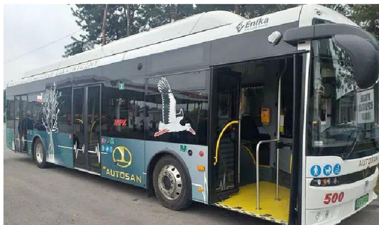
Częstochowa. Miasto polubiło "elektryki".