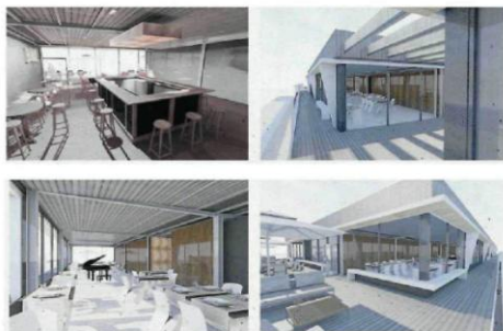
• Aleksandra Kuk w swojej pracy dyplomowej pokazała potencjalne możliwości zagospodarowania dodatkowej kondygnacji – z lokalami gastronomicznymi wyposażonymi w tarasy widokowe.

Pawilon przy Starym Rynku brało już na tapetę paru młodych architektów. Jednak projekt Aleksandry Kuk jest chyba pierwszym, który idzie w poprzek dotychczasowym ocenom częstochowan i nie potępia w czambuł Puchat-