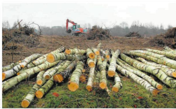
Wycinki wykonano na działce rolnej. Spółka tłumaczy, że nie trzeba było pozwolenia

Jak tłumaczy Urząd Miasta, na miejscu odbyła się kolejna wizja związana ze zgłoszeniem usuwania m.in. drzew i krzewów na działkach przy ul. Wio-