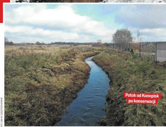
Potok od Konopisk po konserwacji