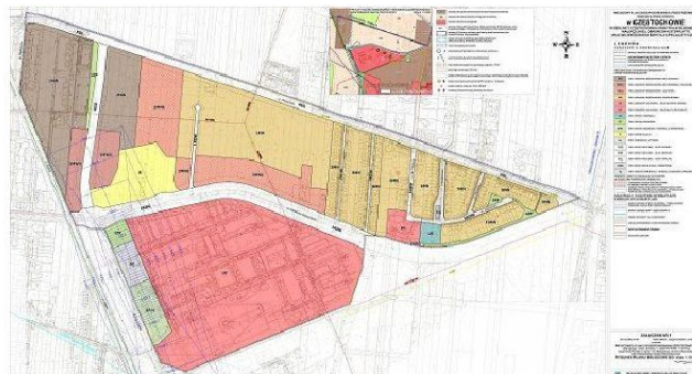
Projekt rysunku planu zagospodarowania

Projekt planu w lepszej rozdzielczości - kliknij TUTAJ