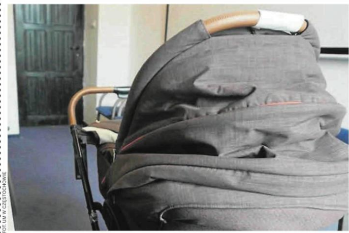
Dla par, które doczekały się dzieci, częstochowska firma Deltim, od początku realizacji programu, dodatkowo nieodpłatnie przekazuje wózki

CZĘSTOCHOWA Bartłomiej Romanek b.romanek@dz.com.pl