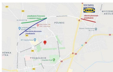
Korytarz Północny i różne pomysły na jego przedłużenie GoogleMaps