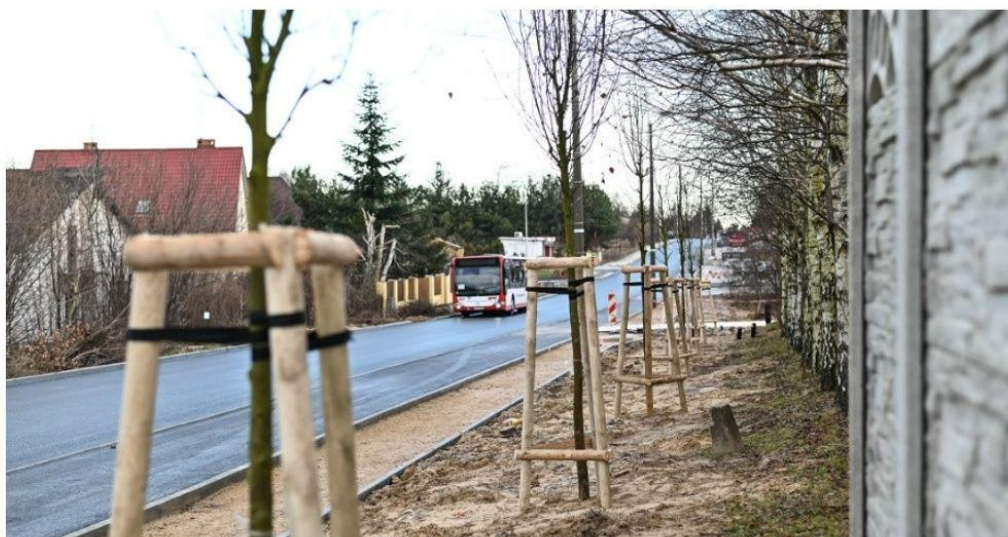
Miejski Zarząd Dróg i Transportu w Częstochowie zadbał o nowe nasadzenia na remontowanej ulicy św. Brata Alberta UM w Częstochowie