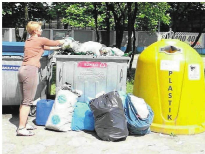
Nowy system opłat za śmieci w rzeczywistości dla wielu mieszkańców oznacza duże podwyżki