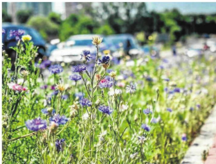
Nowe łąki z kwiatów mają nie tylko cieszyć oko, ale przede wszystkim lepiej pochłaniać smog