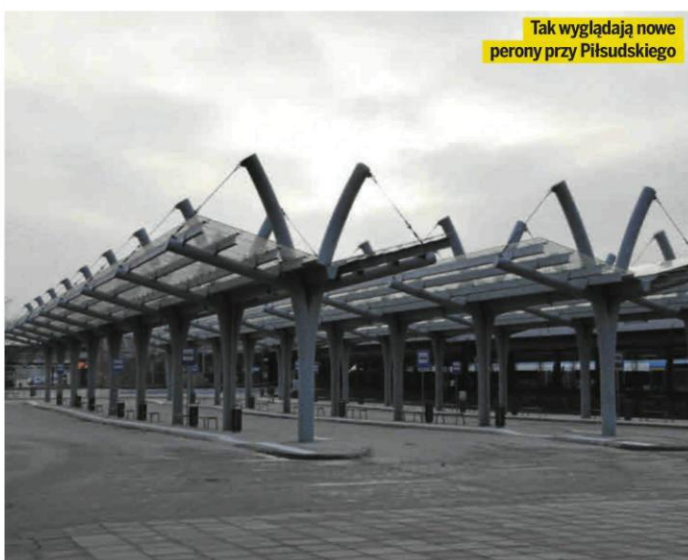
Tak wyglądają nowe perony przy Piłsudskiego

Parking przy dworcu PKP Częstochowa Główna od strony ul. Piłsudskiego ma 4 zadaszone perony, 5 miejsc postojowych