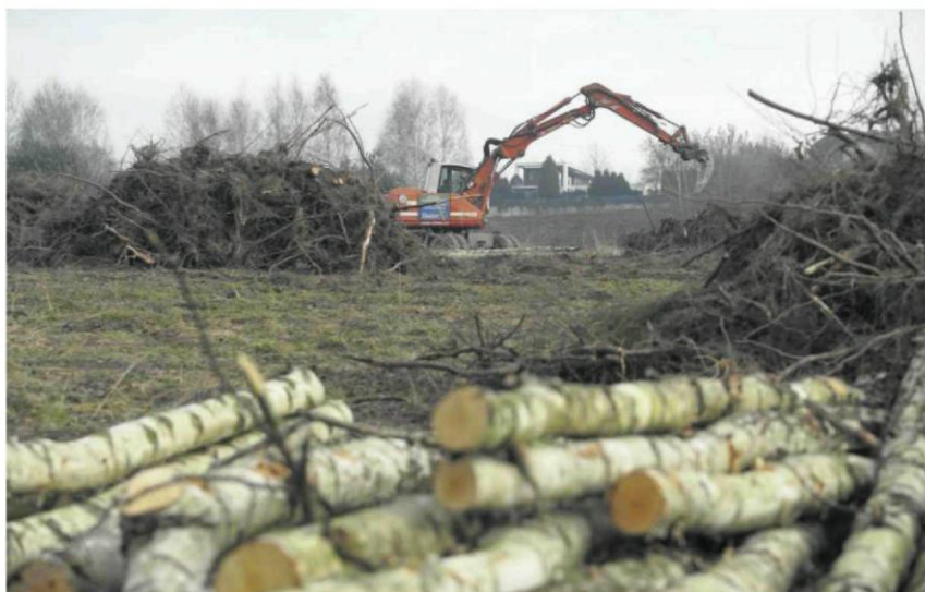
• Pobojuwisko przy ul. Wiolinowej na Grabówce

Teren przy ul. Wiolinowej, o powierzchni 5,6 ha, na której spółka Częstochowa Wiolinowa (założona przez państwową firmę RFG, obsadzoną przez ludzi PIS) chce wybudować osiem bloków w ramach Mieszkania Plus, porastały samosiejki. Ale że lasek rósł od wielu lat, to sporo drzew osiągnęło już spore rozmiary. W efekcie lasek stał się bardzo malowniczym miejscem, chętnie wybieranym na spacerów przez mieszkańców Grabówki.