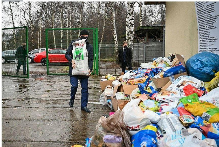
Material urzędu miasta