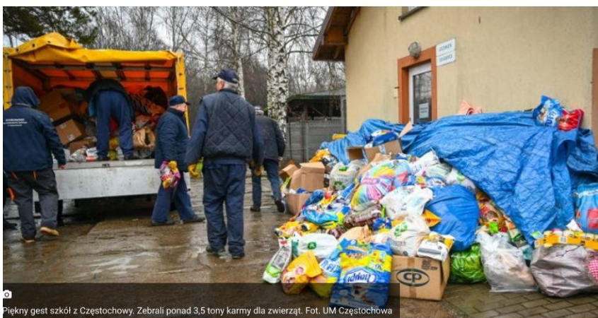
Piękny gest szkół z Częstochowy. Zebrali ponad 3,5 tony karmy dla zwierząt.

Ponad 3,5 tony karmy, około 300 koców, leżanek i innych przydatnych artykułów udało się zebrać podczas zakończonej właśnie V edycji akcji „Charytatywnie dla zwierząt”.