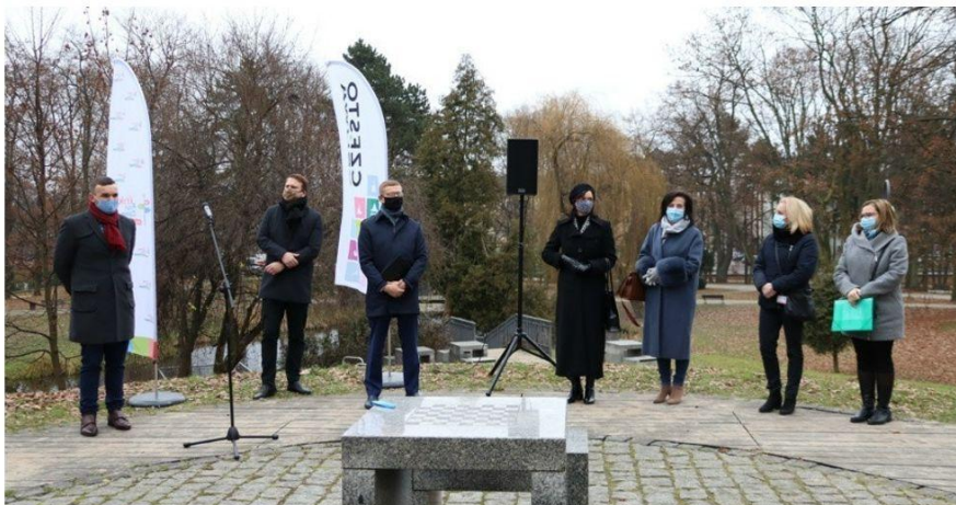
Łąki antysmogowe powstaną w mieście w ramach "Częstozielona" UM w Częstochowie