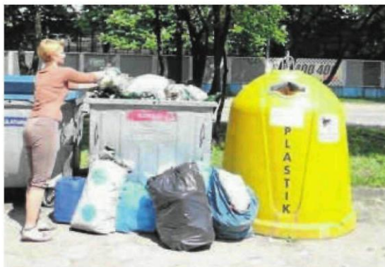
Nowy system opłat za śmieci ma obowiązywać w Częstochowie od 1 stycznia 2021 roku

18 grudnia Regionalna Izba Obrachunkowa wszczęła postępowanie nadzorcze w sprawie uchwały. RIO na razie nie informuje, czego dotyczy wątpliwość Izby. Jak udało się nam dowiedzieć, decyzja w tej sprawie zostanie podjęta 30 grudnia podczas posiedzenia Kolegium. ©P