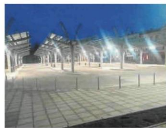
Tak nowe centrum przesiadkowe wygląda w nocy. Jak Wam się podoba?