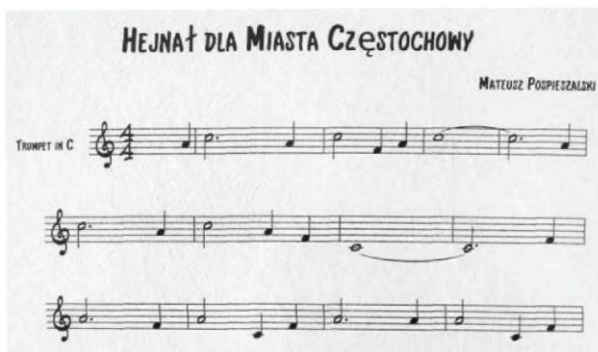
• Zapis nutowy hejnału Częstochowy