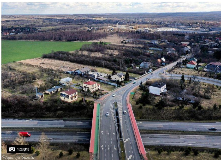
Częstochowa, al. Marszałkowska łączą się z ul. Makuszyńskiego, 11 marca 2020 r.

Sześć firm chce zaprojektować kolejny etap budowy korytarza północnego, tym razem w kierunku wschodnim. Póki co niektóre muszą się wytłumaczyć z niskiej ceny.