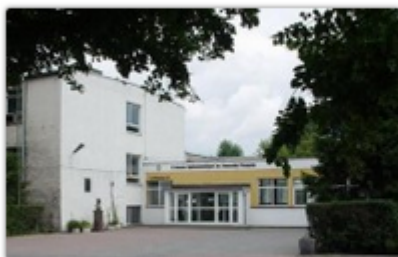
fol. UM Częstochowy

Dwie kolejne częstochowskie szkoły będą docieplone. Miasto ogłosiło przetargi na termomodernizację Zespołu Szkolno-Przedszkolnego nr 3 przy ul. Łukasieńskiego 70 i II LO im. R. Traugutta przy ul. Kilińskiego 62.