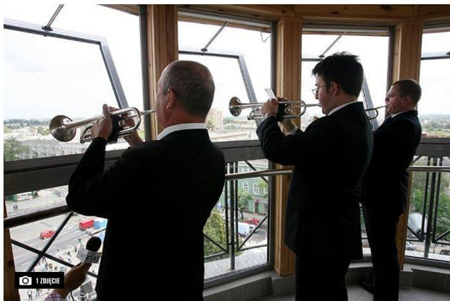
Hejnał na trzy frąbki Zygryda Jajłowickiego wykonany w 2006 r. z ratuszowej wieży w Częstochowie

Radni na najbliższej sesji zajmą się projektem uchwały dotyczącym ustanowienia oficjalnego hejnału Częstochowy. To jeden z najważniejszych punktów obchodów jubileuszy 800-lecia miasta oraz 30-lecia odrodzonego samorządu.