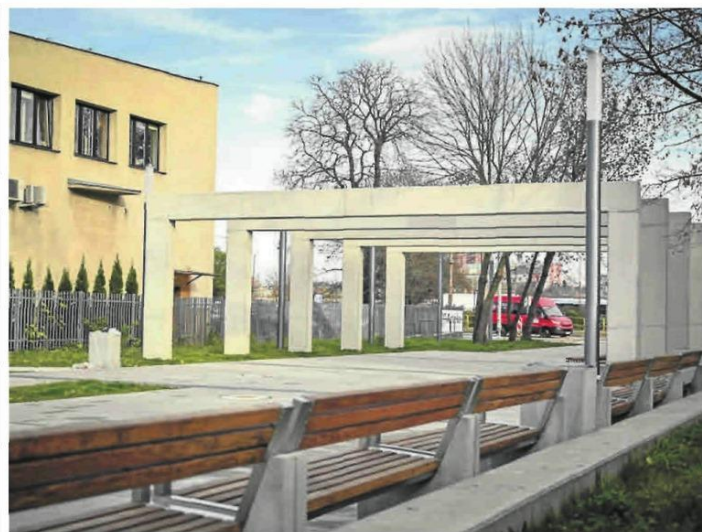
Promenada Śródmiejska w Częstochowa powstawała przez dwa lata