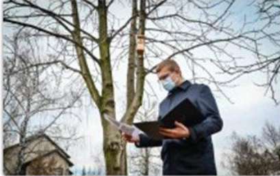
fol. UM Częstochowy

W częstochowskich parkach i na terenach zieleni miejskiej pojawiło się blisko 140 nowych budek lęgowych dla ptaków. To efekt realizacji zadań zgłoszonych w ubiegłorocznej edycji budżetu obywatelskiego. Od grudnia rozpoczęło się też zimowe dokarmianie ptaków.