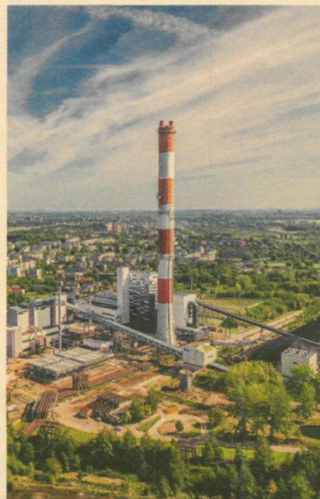
► NÓWKA Z ZABRZA: W Polsce Fortum działa w pięciu miastach, w tym w Zabrzu, gdzie zbudowało wielopaliwową elektrociepłownię, oddaną do użytku w 2019 r.

W Polsce Fortum działa w pięciu miastach: Płocku, Częstochowie, Bytomiu, Zabrze oraz Wrocławiu, gdzie ma instalacje, sieci ciepłownicze lub oba te aktywa. Jest też właścicielem dwóch wielopaliwowych elektrociepłowni w Częstochowie i Zabrzu, które zostały oddane do użytku odpowiednio w latach 2010 oraz 2019. ☉☉