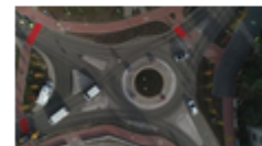
Rondo 2020 roku. "Każdy będzie miał swoje wspomnienia"

Nazwę Praw Kobiet będzie nosiło rondo przy dworcu PKP Stradom, które powstało niedawno przy okazji budowy centrum przesiadkowego.