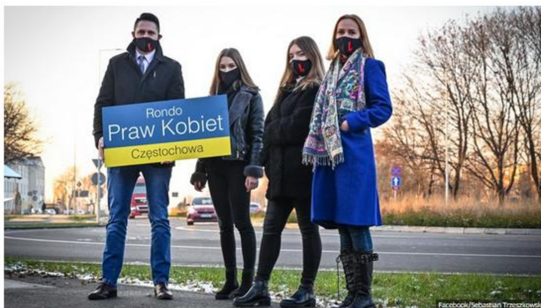
Rondo im. Praw Kobiet w Częstochowie znajdzie się przy stacji kolejowej