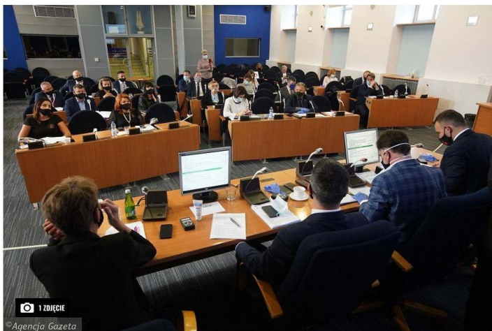
1 ZDJĘCIE Sesja rady miasta w Częstochowie, 29 października 2020 r.

Dorota Steinhagen · 4 grudnia 2020 | 06:01