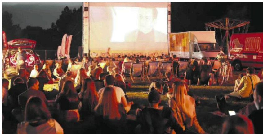
Kino na leżakach wywalczyli sobie mieszkańcy Rakowa, Zawodzia i Wrzosowiaka. To w Częstochowie popularna rozrywka, co było widać w parku Lisiniec w 2018 r.

I tak było właśnie ze zgłoszonymi do zadań ogólnomiejskich Dzielnicowymi Klubami Mieszkańca – pomysłem krytykowanym zresztą w mediach społecznościowych. Internauci dopytawali, kto za co miałby otrzymać pieniądze i ile (720 tys. zł na plac przy wartości projektu 1,15 mln zł). Ponad 25 tys. punktów dało temu zadaniu trzecie miejsce – po projekcie „Częstochowanie bezdomnym zwierzętom ze schroniska” (ponad 29 tys. punktów i 260 tys. zł na realizację) oraz budowie boiska Victorii Częstochowa ze sztuczną nawierzchnią (niemal 28 tys. punktów i 1,12 mln zł). „Wartość” klubów dzielnicowych oszacowano na 1,15 mln zł, a tyle już w puli nie zostało. Nie wystarczyło także na trzy kolejne pod względem liczby otrzymanych punktów zadania: „Łączy nas chodnik – dzielnicę Wyczerpy-Aniołów, Zawodzie, Kiedrzyń”, „Budowa boiska syntetycznego na terenie VI Liceum Ogólnokształcącego” oraz „Aktywnie, zdrowo i sportowo w Częstochowie”. Następnym zadaniem przeznaczonym do realizacji stał się więc zakup respiratorów do szpitali miejskich za 550 tys. zł – a także parę drobniejszych przedsięwzięć.