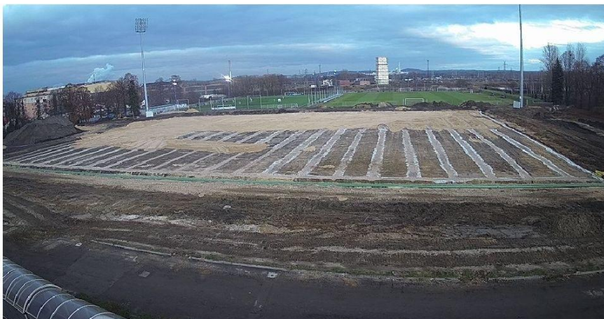
Modernizacja stadionu Rakowa Częstochowa może się opóźnić MOSiR Częstochowa

Firma InteHall, wykonawca stadionu Rakowa Częstochowa, poinformowała Urząd Miasta w Częstochowie, że z powodu panującej pandemii inwestycja może się przedłużyć. - To na razie informacja, z której nie wynikają konkretne terminy. Co jednak ważne jest już pozwolenie na budowę, a wykonawca podpisał umowy z podwykonawcami - mówi Michał Konieczny, naczelnik Wydziału Inwestycji Urzędu Miasta w Częstochowie. Opóźnienie może mieć wpływ na finanse klubu, który od 7 lutego będzie musiał płacić karę 30 tysięcy złotych za każdy mecz rozegrany poza Częstochową.