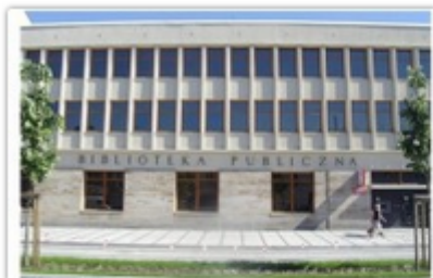
fol. UM Częstochowy

Od wtorku, 1 grudnia do 27 grudnia, zgodnie z rozporządzeniem rządu, wznawiają działalność placówki biblioteczne w Częstochowie.