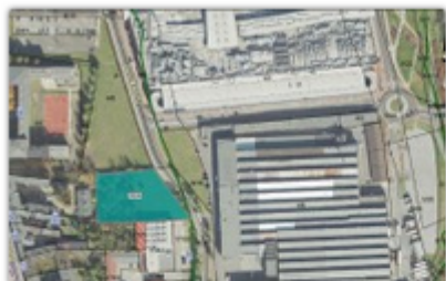
fol. UM Częstochowy

Miasto wystawiło na sprzedaż kolejne cztery działki w dzielnicach: Stare Miasto, Częstochówka-Parkitka i Stradom. Przetarg odbędą się 21 i 29 grudnia.