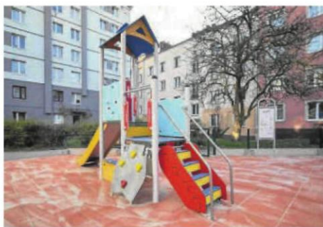
W ramach budżetu obywatelskiego powstały w Częstochowie m.in. place zabaw

„Częstochowianie pomagają zwierzętom - darmowa sterylizacja psów i kotów posiadających właścicieli” (31 tys. zł), „Remont i doposażenie sali gimnastycznej w SP26” (25 tys. zł), „Zakup umundurowania dla OSP Częstochowa-Gnaszyn” (43,5 tys. zł), „Dodanie Częstochowy do Google Transit” (brak kosztów) oraz „Bramki do rugby na Miejskim Stadionie Lekkoatletycznym” (14,5 tys. zł). Listę zwycięskich projektów ogólnomiejskich zamykają zadania służące pieszym i rowerzystom (zwiększeniu ich widoczności), a więc: „Poprawa bezpieczeństwa na przejściu dla pieszych” na pl. Daszyńskiego (750 zł) oraz „Poprawa bezpieczeństwa skrzyżowania ul. Krakowska, Kanał Kohna” (800 zł). ©©