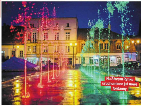
Na Starym Rynku uruchomiono już nowe fontanny

Częstochowy Zbigniew Niemacznik. W sumie nad zmodernizowanym Starym Rynkiem zawiąże 14 rzeźb Jerzego Kędziory. Ich montaż potrwa do 15 grudnia.