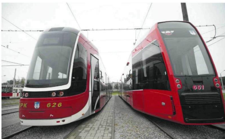
• Na funkcjonowanie komunikacji Częstochowa chce przeznaczyć w 2021 r. o 6 mln zł mniej niż w obecnym roku

W nadchodzącym roku inwestycje mają pochłonąć 306 mln zł. Miasto zamierza przeprowadzić głównie te, na które są już podpisane umowy. W przyszłym roku zacznie się wreszcie wielkie przedsięwzięcia drogowe, czyli przebudowa alei Wojska Polskiego (DK1) wraz z dobudową dwóch estakad na skrzyżowaniach z Krakowską i Legionów oraz modernizacja wyłotu na Opole (DK46) z wytyczeniem obbiegi kościoła św. Barbary. W projekcie budżetu na 2021 r. większe środki widnieją na tę drugą inwestycję.