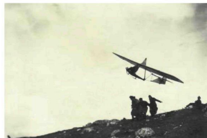
• Góra Ossona, szkoła szybowcowa.

Czasy stalinowskie przystopowały działalność. W dodatku rozbudowa Huty Bieruta spowodowała likwidację w 1953 r. lotniska na Kucelinie. Wprawdzie aeroklubowi przekazano zbudowane przez