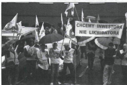
Z takimi transparentami w czerwcu ubiegłego roku protestowali hutnicy z Częstochowy. Po ponad roku nadal nie mogą być pewni swojej przyszłości.

Co będzie dalej? Jak się przekonaliśmy trudno cokolwiek wyrokować. Zainwestowaliśmy duże środki finansowe w uruchomienie tej huty, mamy wizję jej rozwoju, zaangażowaliśmy również wiele wysiłku, by wygrać przetarg, dlatego tak łatwo się nie poddamy. Na dzień dzisiejszy spółka Sunningwell International Polska przedłużyła umowę dzierżawy Huty Częstochowa do końca czerwca 2021 r.