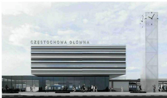
• Projekt nowego dworca od strony ul. Piłsudskiego. FOT. TOPPROJEKT MAREK WAWRZYŃIAK / AND STUDIO / STUDIO ANTONI

Konkurs na zaprojektowanie przebudowy dworca głównego w Częstochowie został rozstrzygnięty niespełna rok temu. Podzielony był na dwie części: realizacyjną, którą wykonają PKP, oraz studialną, gdzie architekci mieli pokazać, jak można zagospodarować teren w pobliżu dworca (od strony zachodniej). Jury, w skład którego wchodziłi przedstawiciele PKP, miasta oraz częstochowskiego oddziału Stowarzyszenia Architektów Polskich, uznało, że najlepszą pracę przygotowały wspólnie