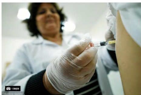
Zamierzanie szczepieniami przeciwko grypie jest w tym roku ogromne

Dorota Sierahagen 3 listopada 2020 | 06:04