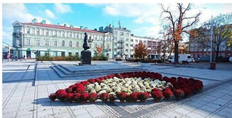
Kwiaty na pl. Biegańskiego, 31 października 2020 r.

Pomoc zaoferowały także władze Częstochowy. – MZDiT jeszcze w sobotę poprosił za pośrednictwem strony na Facebooku zainteresowanych odstąpieniem od decyzji na zajęcie pasa drogowego o przesłanie mailowo wniosku z taką prośbą. Pozwoli to sprzedającym w części zminimalizować straty, jakie ponieśli – informuje rzecznik drogowców Maciej Hasik.