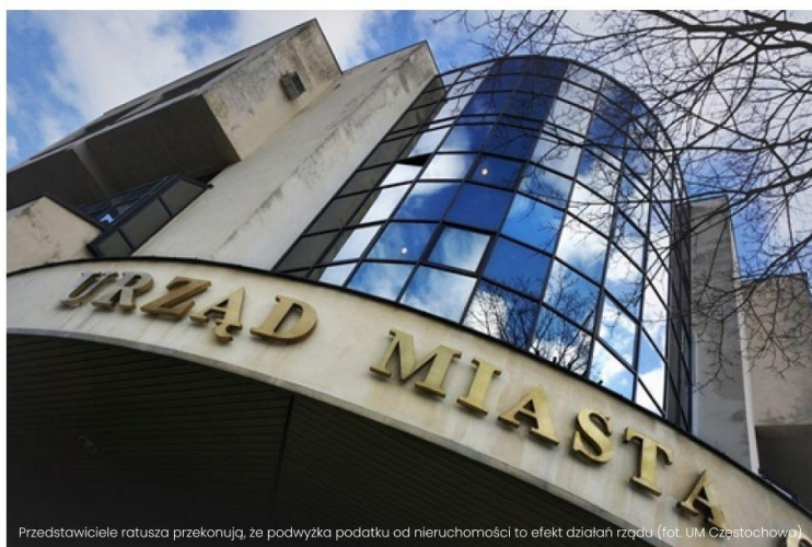
Przedstawiciele ratusza przekonują, że podwyżka podatku od nieruchomości to efekt działań rządu

Rada miejska Częstochowy przyjęła stawki podatków i opłat lokalnych na rok 2021. Wzrośnie m.in. podatek od nieruchomości, nie zmieni się natomiast podatek od środków transportu. Przedstawiciele ratusza przekonują, że podwyżka tego pierwszego to efekt działań rządu.