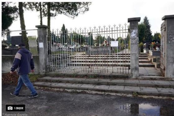
Zamknięty cmentarz Kule w Częstochowie, 31 października 2020 r.

Niespodziewana decyzja rządu o zamknięciu nekropolii była kosztowna nie tylko dla przedsiębiorców. Przygotowane przez miasto zmiany w organizacji ruchu i komunikacji miejskiej też kosztowały, a okazały się bezużyteczne.