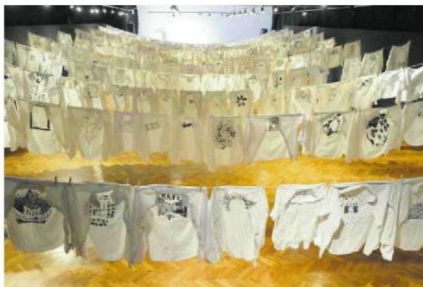
• Wystawa „Moment zawieszenia”

– Charakterystyczną cechą jego malarstwa jest zastosowanie szablonu wykonywanego najczęściej na podstawie zdjęć prasowych. Artysta nawiązuje do po-