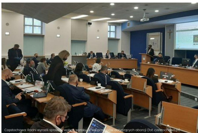
Częstochowa: Radni wyrazili sprzeciw wobec wyroku TS w sprawie przepisów dotyczących aborcji

Rada Miasta Częstochowy wyraziła w czwartek sprzeciw wobec ostatniego wyroku Trybunału Konstytucyjnego w sprawie przepisów dotyczących aborcji. Wypowiedzenie kompromisu aborcyjnego jest niemoralne, skazuje kobiety na piekło - oświadczyli radni.