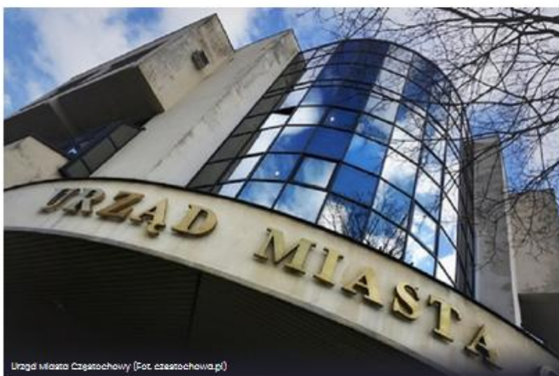
Urząd Miasta Częstochowy

Podczas dzisiejszej (29 października 2020 r.) sesji Rada Miasta Częstochowy przyjęła stanowisko sprzeciwiające się wyrokowi Trybunału Konstytucyjnego w sprawie uznania za niezgodne z Konstytucją przepisów dotyczących aborcji w przypadku dużego prawdopodobieństwa ciężkiego i nieodwracalnego upośledzenia płodu albo nieuleczalnej choroby zagrażającej jego życiu.