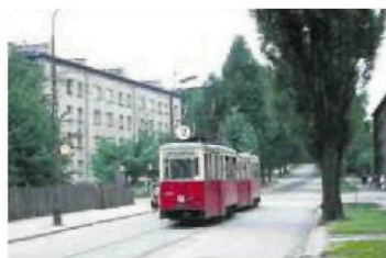
• 1970 r.: tramwaj nr 2 na ul. Łukasieńskiego

Kursy linii 2 z Tysiąclecia na ul. Łukasieńskiego zostały zakończone w 1971 r. Obecnie o tym, że ulicą jeździły tramwaje, przypominają metalowe, kratownicowe słupy trakcyjne, ale pod warstwą asfaltu wciąż leży tor. Do niedawna widoczny był on za to w brukowanej jezdni przy rezerwacie archeologicznym, jednak w ramach budowy węzła przesiadkowego i na tym odcinku wylano asfalt.