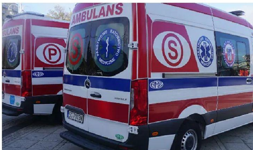
Karetki nie są w stanie przekazać pacjenta do żadnego szpitala.

Zobacz, czy już dziś wygrasz 25 000 zł! URODZINY.WP.PL