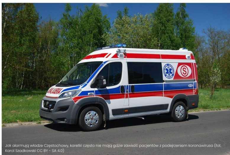
Jak alarmują władze Częstochowy, karetki często nie mają gdzie zawieźć pacjentów z podejrzeniem koronawirusa

Władze Częstochowy domagają się utworzenia dodatkowych miejsc izolacji w szpitalach w mieście lub najbliższej okolicy. Ma to zapewnić właściwą opiekę pacjentom z Covid-19, a także tym z objawami zakażenia koronawirusem, a jeszcze niezdiagnozowanym na jego obecność. Nowe miejsca dla osób chorych na Covid-19 są tworzone obecnie m.in. w placówce Wojewódzkiego Szpitala Specjalistycznego przy ul. PCK w Częstochowie.