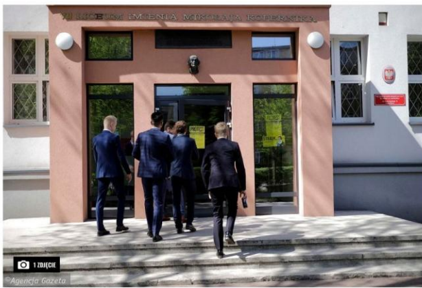
Agencja Gazeta GRZEGORZ SKOWRONEK

Marek Mamór | 13 października 2020 | 16:44