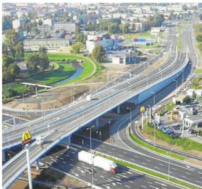
Śledztwo było związane z budową nowego węzła na DK1 w Częstochowie

Jak podkreślał w uzasadnieniu sąd, oskarżeni zdecydowali się na wystawienie fałszywej faktury, bo nie było innej możliwości zapłaty spółce „Warta” za wykonaną pracę, a bez modernizacji komory ściekowej mogłoby dojść do opóźnienia inwestycji i strat znacznie wyższych. Zażalenie prokuratury zostało uwzględnione i proces rozpoczął się w październiku 2020 roku. Jednak ze względu na ważny interes państwa, jest on niejawnym ©