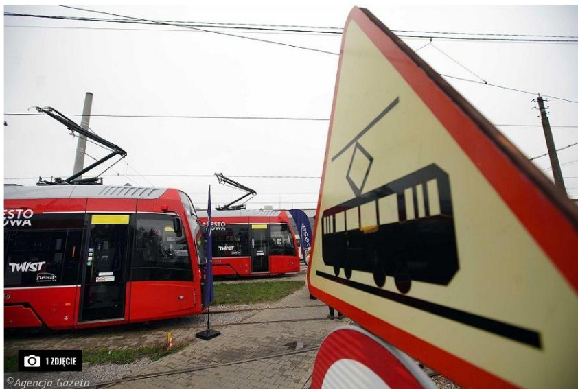
MPK w Częstochowie

Dorota Steinhagen 8 października 2020 | 06:47