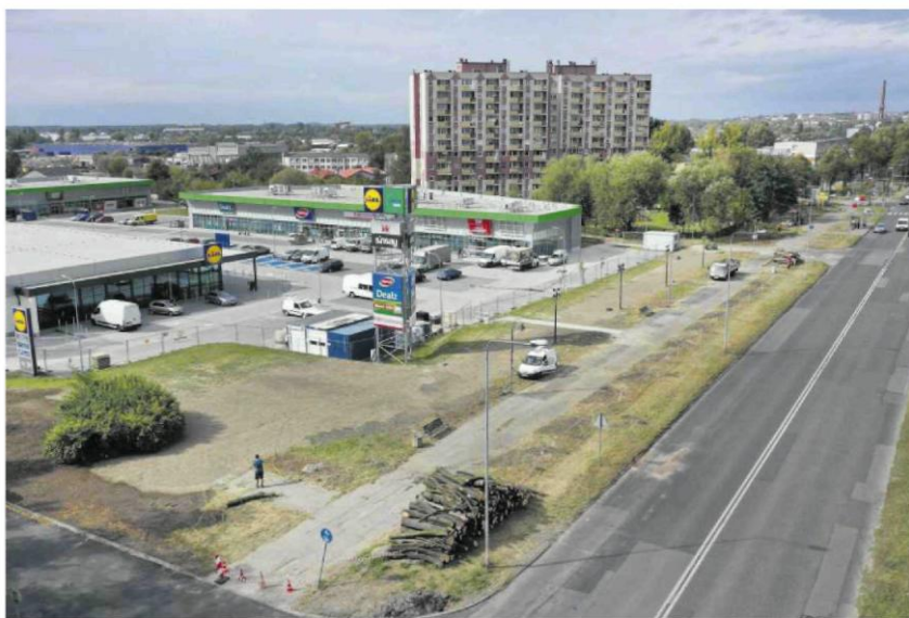
• Kolejna „wyspa ciepła” w Częstochowie: al. Niepodległości z wykarczowanym szpalerem drzew

– Pozwolenie na wycinkę było bezpośrednio podktykowane realizacją inwestycji budow-