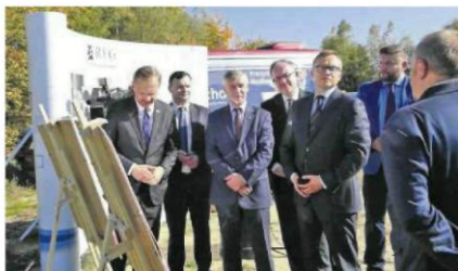
• Częstochowa, 2018 r. Prezentacja koncepcji programu „Mieszkanie plus” na Grabówce.