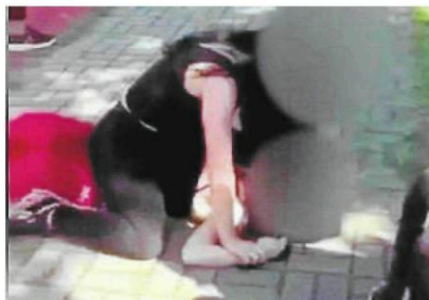
Media społecznościowe w Częstochowie obiegło szokujące nagranie z Zespołu Szkół im. S. Żeromskiego w Częstochowie