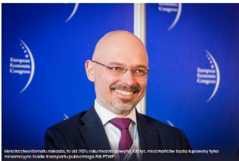
Ministerstwo Klimatu zakłada, że od 2021 roku miasta powyżej 100 tys. mieszkańców będą kupowały tylko zeroemisyjne środki transportu publicznego.

Od początku 2021 r. samorzady będą mogły wnioskować o dotacje na zakup zeroemisyjnych autobusów – poinformował minister klimatu Michał Kurtyka. Dodał, że budżet nowego programu wyniesie 1,3 mld zł i za te pieniądze ma zostać kupionych przynajmniej 500 autobusów.