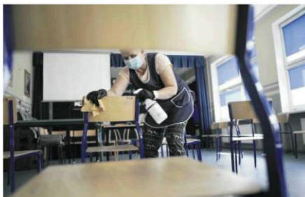
• Przygotowania do rozpoczęcia roku szkolnego w Szkole Podstawowej nr 53 przy ul. Orkana

Co było najtrudniejsze w związku z przygotowaniem do tego roku szkolnego? – Zapewnienie dystansu społecznego, co przy takim zagęszczeniu osób jest co najmniej trudne. Przygotowujemy sale. Dla najliczniejszych klas wybrałiśmy te większe. Wstawiamy do nich dodatkowe ławki, żeby uczniowie siedzieli jak najdalej od siebie. Nie ukrywamy, nie zawsze da się zachować odstęp 1,5 m. Każda klasa będzie miała swoją salę i nie będzie częstej konieczności przechodzenia na przerwie do nowej pracowni. Poza informatykę, czasami językami obcymi oraz wuefem nie jest to konieczne. Przygotowujemy korytarze, żeby dzieciaki i pracownicy, gdy jest to już koniecz-