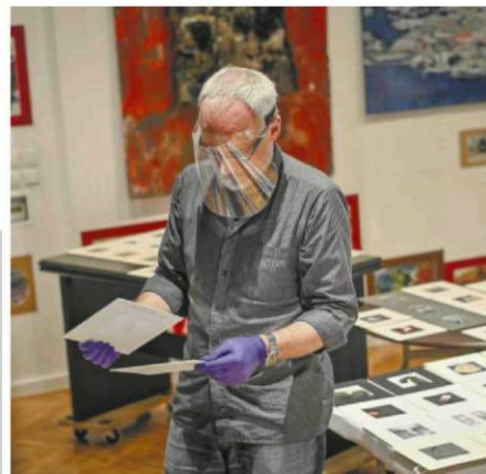
• Przygotowania do Międzynarodowego Biennale Miniatury