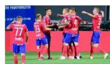
Fortuna Puchar Polski: Pewne zwycięstwo Rakowa w Nowym Sączu