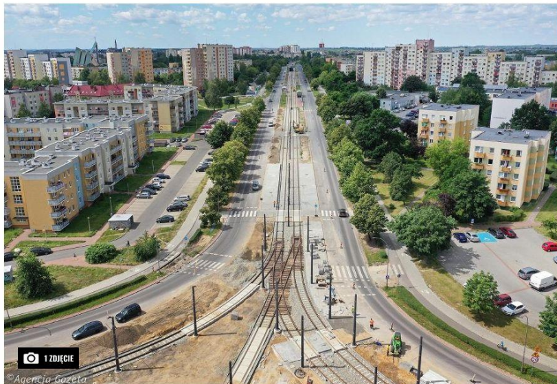
1 ZDJĘCIE

W związku z pandemią koronawirusa rząd zapowiedział uruchomienie Funduszu Inwestycji Lokalnych. Częstochowie przysługuje 25,1 mln zł, ale póki co nie wiadomo, jak te pieniądze zostaną wydane.