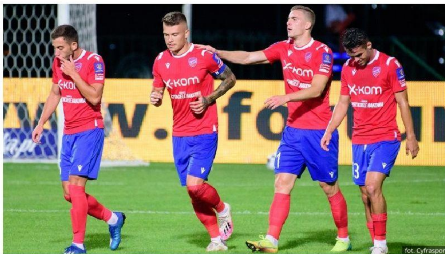
Piłkarze Rakowa Częstochowa występują w koszulkach bez herbu miasta.