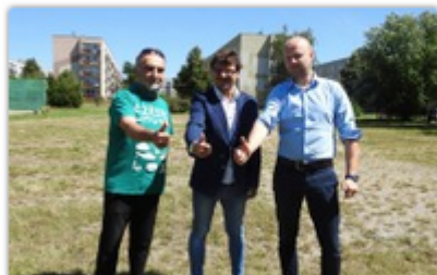
fol. Lwy Avia Częstochowa

Cztery oferty wpłynęły w przetargu na budowę kompleksu sportowego oraz odwodnienia w dzielnicy Wrzosowiak. Inwestycja zostanie zrealizowana ze środków budżetu obywatelskiego.