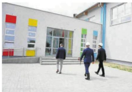
Remonty wykonano w dwóch przedszkolach, bursie i 5 szkołach. Kosztowały one miasto blisko 760 tys. zł