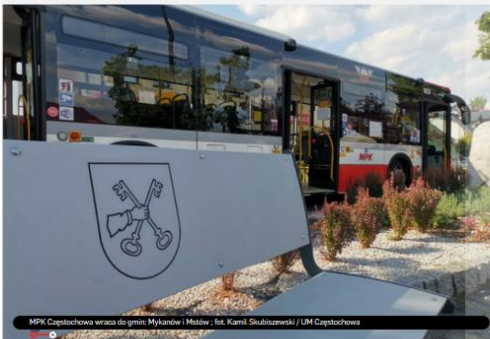
MPK Częstochowa wraca do gmin: Mykanów i Mstów

InfoBus.pl - Opublikowano: 24.08.2020 13:00:32