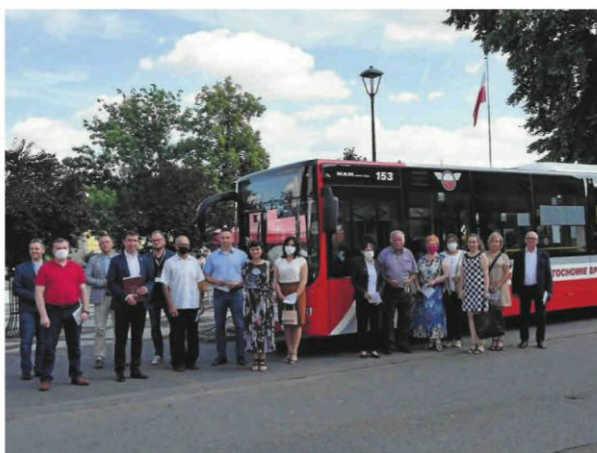
Od 1 września autobusy MPK Częstochowa pojadą do Mstowa. Bilet będzie kosztował 3,6 zł