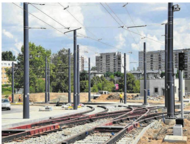
Oświetlenie powstaje przy okazji budowy nowej linii tramwajowej w Częstochowie