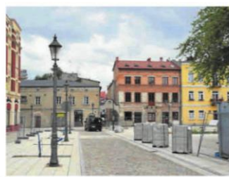
Rewitalizacja obejmuje nie tylko sam Stary Rynek, ale również przyległe uliczki