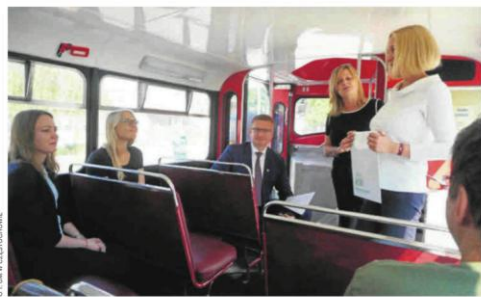
W ubiegłym roku budżet obywatelski promowano m.in. w autobusie piętrowym