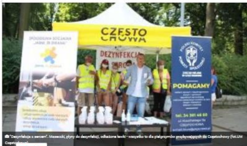
„Dezynfekcja z sercem”. Maseczki, płyny do dezynfekcji, odkażone ławki – wszystko to dla pielgrzymów przybywających do Częstochowy