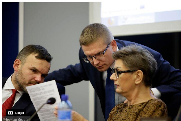
1 ZDJĘCIE