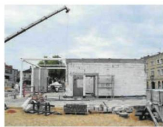
Tak obecnie wygląda pawilon, który ma być jednym z elementów zrewitalizowanego rynku