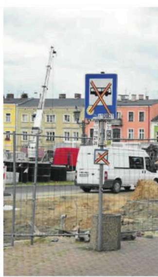
Przy okazji rewitalizacji Starego Rynku, przebudowana zostanie również ulica Mirowska