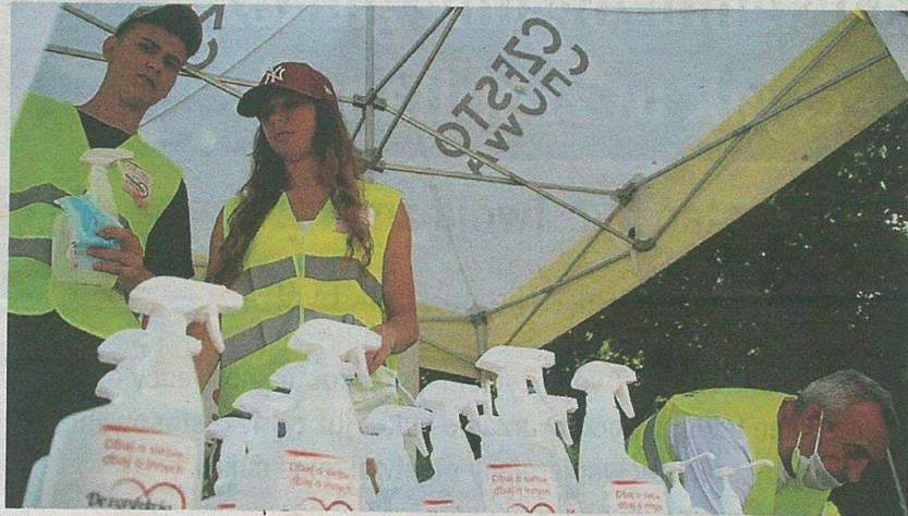
W ramach akcji na pielgrzymów czekają maseczki i płyny do dezynfekcji

Realizacją, zleconą przez Urząd Miasta akcji „Dezynfekcja z sercem” zajmuje się częstochowski oddział Polskiego Komitetu Pomocy Społecznej oraz Spółdzielnia Socjalna „Jasne, że zmiana”. W jej ramach - w specjalnym punkcie na początku al. Sienkiewicza - pracownicy i wolontariusze rozdają maseczki, mierzą temperaturę, dezynfekują dłonie oraz wręczają serduszka-naklejki z hasłem „Dbaj o siebie, dbaj o innych”. Zajmują się również wielokrotną dezynfekcją 300 miejsc ławek, 30 przenośnych WC oraz 100 koszy, zlokalizowanych w ciągu spacerowym alei NMP, alei Sienkiewicza oraz w parkach podjasnogórskich. Akcja potrwa do 15 sierpnia.