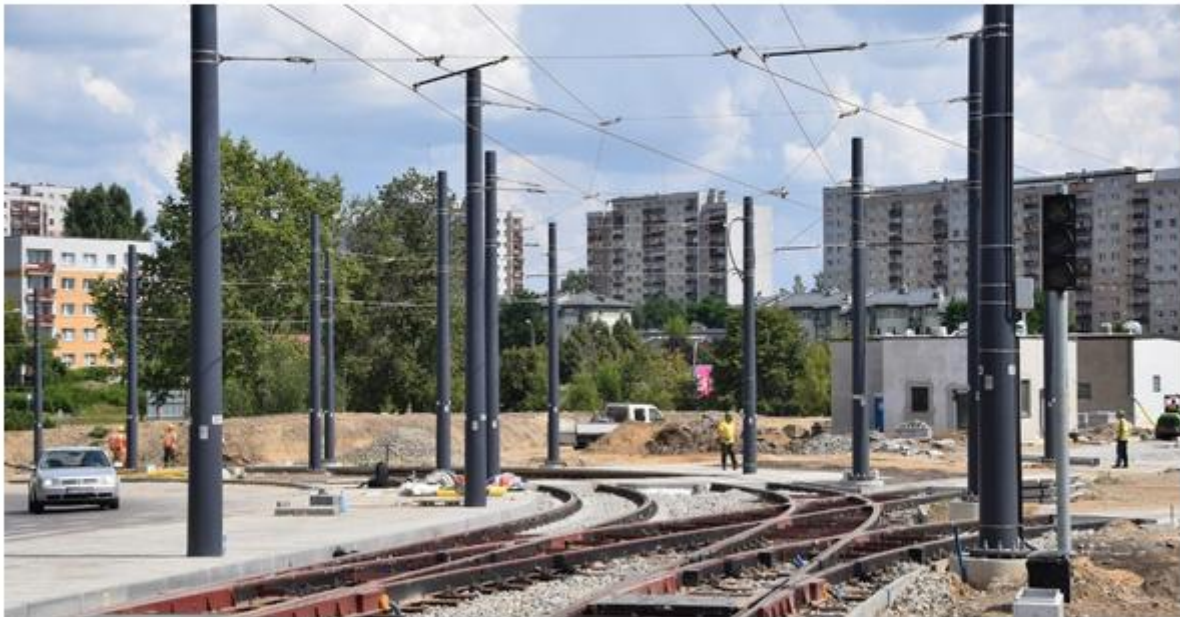
Budowa pętli tramwajowej w dzielnicy Północ w Częstochowie. Zobacz kolejne zdjęcia. Przesuwaj zdjęcia w prawo - naciśnij strzałkę lub przycisk NASTĘPNE