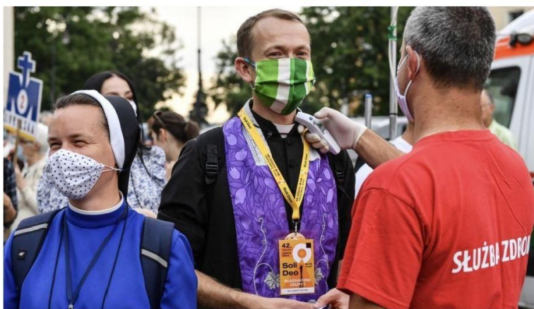
■ Pielgrzymom jest mierzona temperatura

O regulacje dotyczące pielgrzymowania z obszarów szczególnie zagrożonych koronawirusem zawnioskowały do ministra zdrowia Łukasza Szumowskiego władze samorządowe Częstochowy. Kontekst to doroczny jasnogórski szczyt pielgrzymkowy przypadający na połowę i drugą połowę sierpnia.