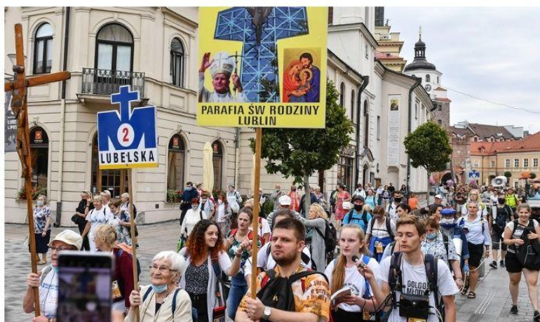
Start 42. Lubelskiej Pieszej Pielgrzymki na Jasną Górę z Archikatedry Lubelskiej

Przed nami doroczny jasnogórski szczyt pielgrzymkowy, przypadający na połowę i drugą połowę sierpnia. W związku z tym władze Częstochowy zwróciły się do ministra zdrowia o regulacje, dotyczące pielgrzymów z regionów szczególnie zagrożonych koronawirusem.