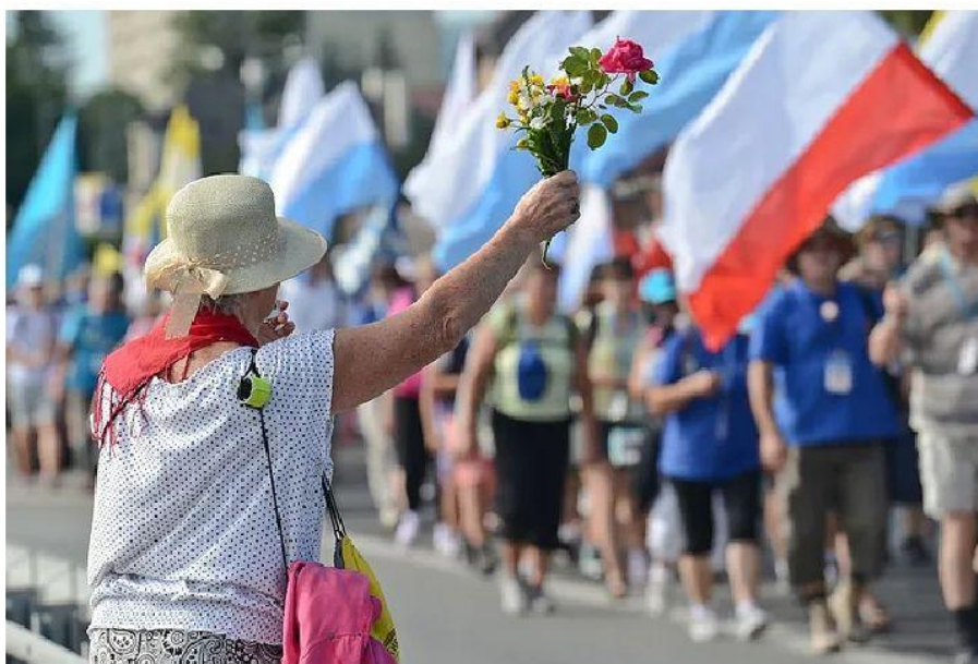
Pielgrzymki do Częstochowy. Miasto apeluje do ministra zdrowia Łukasza Szumowskiego