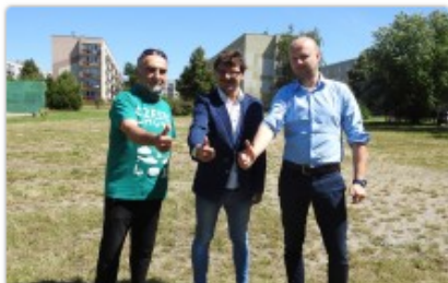
fol. Lwów Avia Częstochowa

Miasto ogłosiło przetarg na budowę kompleksu sportowego oraz odwodnienia w dzielnicy Wrzosowiak. Inwestycja zostanie zrealizowana ze środków budżetu obywatelskiego.