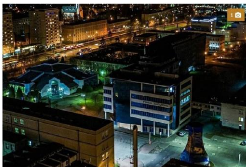
Częstochowa jest większa od 7 miast wojewódzkich w Polsce