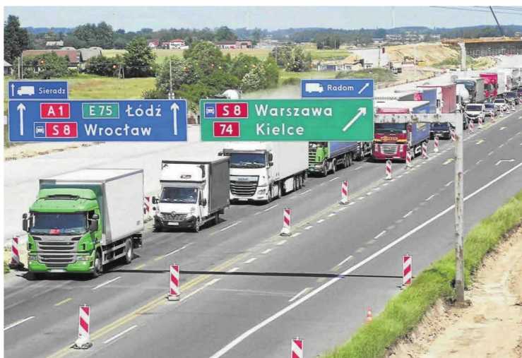
Budowa autostrady A1 w okolicach Piotrkowa Trybunalskiego w lipcu 2020. Widać nowy wiadukt.

skiem. Do śpięcia całej drogi brakuje 81 km, a w woj. śląskim - 17 do granicy z woj. łódzkim. Jest jednak plan na to, by kierowcy jadący tędy mieli lepiej.