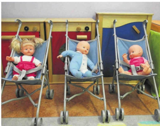
Od czerwca 2019 do czerwca 2020 w Polsce urodziło się 369 tysięcy dzieci. Jednocześnie w tym okresie zmarło 409 tys. Polaków. To tak, jakby w Polsce ubywało wielkości Oświęcimia