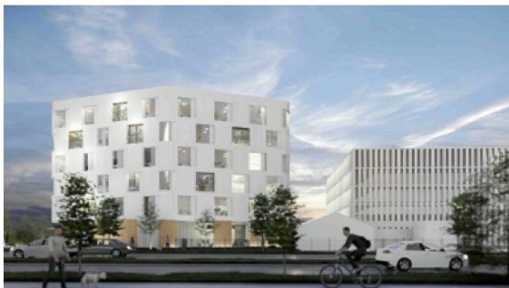
Rocha Center – wizualizacje.

W bezpośrednim sąsiedztwie nowej siedziby sądu przy św. Rocha 80/90, projektowany jest właśnie nowoczesny, sześciokondygnacyjny obiekt usługowo-biurowy o łącznej powierzchni minimum 2400 m 2 , w systemie open space, czyli przestrzeni otwartej, którą najemca będzie mógł jednak aranżować w dowolny sposób. Usytuowanie budynku na działce ma