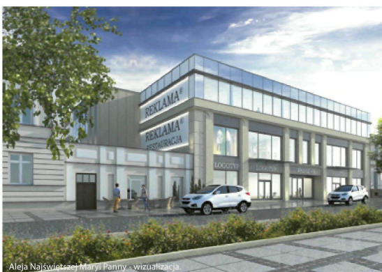
Aleja Najświętszej Maryi Panny - wizualizacja