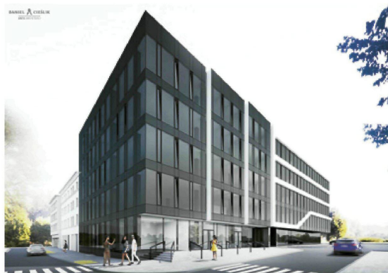
Częstochowianka / Jasnogórska 75 – wizualizacje.

Gdy w roku 2018, Koncern ZF Friedrichshafen AG (obecny w Częstochowie od 2015 r., gdy połączył się z istniejącym tu od ćwierć wieku koncernem TRW) – świętował powstanie kolejnej siedziby – w nowoczesnym biurowcu znalazło swoje miejsce centrum IT, zatrudniające ponad 200 osób. Firma stale się rozwija i zatrudnia w Częstochowie ponad 6 tys. osób.