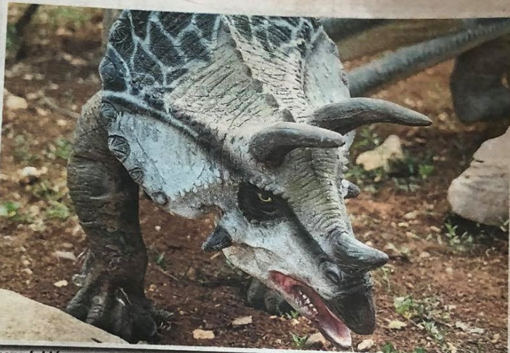
Dinopark, który ma powstać przy Promenadzie Czesława Niemena, ma powstać do 30 października 2020 roku. Oczywiście o ile planów nie skomplikuje koronawirus

Teraz taki zakątek, który z pewnością będzie pobudzał dziecięcą fantazję - a przy okazji będzie terenem wypoczynkowym dla całych rodzin - ma powstać także w Częstochowie. Zdecydowali o tym sami