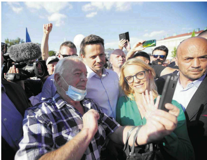
• Małgorzata i Rafał Trzaskowscy 4 lipca na pl. Biegańskiego

Trzaskowski przyznał jednak, że takie miasta jak Częstochowa trzeba wspierać. Za-