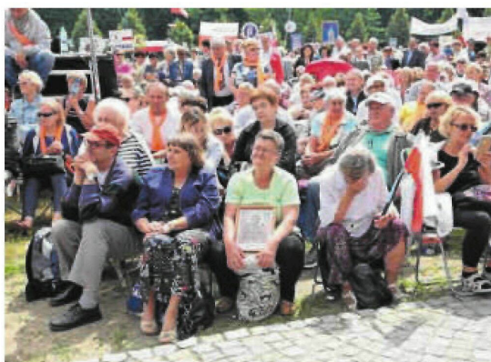
W pielgrzymkach Rodziny Radia Maryja udział brało nawet 100 tysięcy osób. W tym roku będzie ich kilkanaście tysięcy

W tym roku kazanie wygłosi abp Marek Jędraszewski, metropolita krakowski, znany ze swoich kontrowersyjnych poglądów i wystąpień. Ale w sobotę nie powinno być polityki na Jasnej Górze nie tylko z powodu ciszy wyborczej, ale i nowego regulaminu klasztoru, który zakazuje wystąpień politycznych podczas wy-