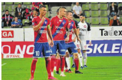
Piłkarze Rakowa w tym roku grają w Bełchatowie. Gdyby tak było także wiosną 2021 klub musiałby płacić 30.000 zł za każdy mecz

Potwierdziły się nasze wcześniejsze ustalenia. Do UM w Częstochowie wpłynęło oświadczenie o wycofaniu się z przetargu na modernizację stadionu, złożone przez konsorcjum firm STADION PRO Sp. z o.o. i GRANI-TEC. Obie firmy zrze-