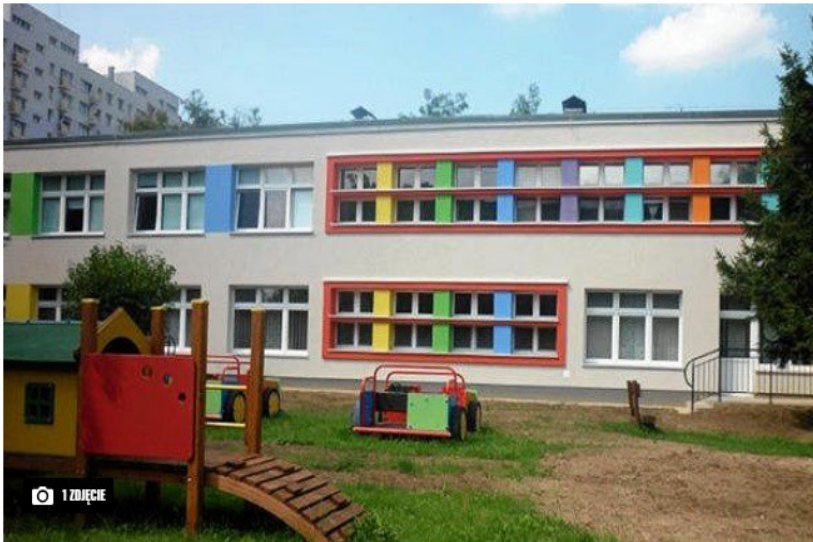
Miejski żłobek przy al. Armii Krajowej w Częstochowie (Materiał urzędu miasta)

Większe limity dla grup dzieci w przedszkolach, oddziałach przedszkolnych i żłobkach to główne zmiany w wytycznych przeciwepidemicznych wprowadzone przez Głównego Inspektora Sanitarnego. Oznacza to, że w częstochowskim żłobku miejskim możliwe jest już obecnie przyjęcie w tej placówce ponad 200 dzieci.