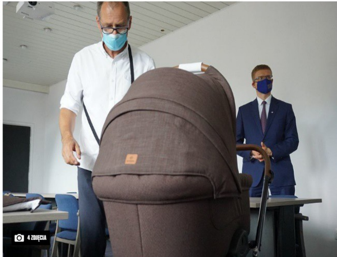
Wózek z firmy Delfin przekazany rodzicom dziewczynki urodzonej dzięki miejskiemu programowi in vitro

Na świat przyszła kolejna - już 27. - dziewczynka urodzona w ramach miejskiego programu dofinansowania zabiegów in vitro. To już 51. mały mieszkaniec Częstochowy urodziny dzięki temu wsparciu.