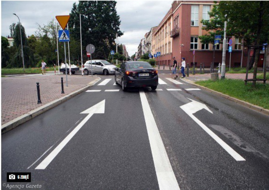
Wylot ul. Waszyngtona w Śląską - już jednokierunkowy

Od poniedziałku w centrum Częstochowy obowiązuje nowa organizacja ruchu: zgodnie z nią ul. Waszyngtona pomiędzy al. Wolności a Śląską jest w całości jednokierunkowa, łącznie z odcinkiem przed wejściem do Urzędu Miasta.