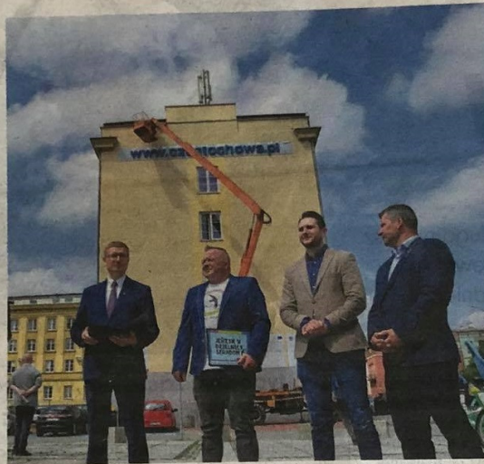
Budki lęgowe dla jerzyków zostały powieszono na budynku Urzędu Miasta w Częstochowie

Pomysłodawcą montażu budek dla jerzyków jest