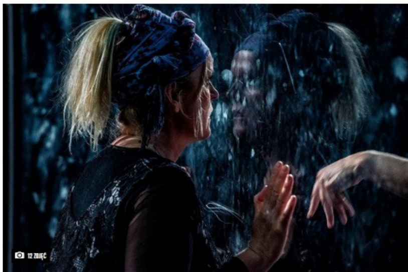
"Fałsz" w reż. André Hübner-Ochodlo

Przedstawienie - polską prapremierę - przygotował André Hübner-Ochodlo. Przedpremierowy pokaz odbędzie się w piątek, 26 czerwca, na scenie Teatru im. Mickiewicza. Pod koniec sierpnia zaplanowano oficjalną premierę w Sopocie, a z początkiem września w Częstochowie.