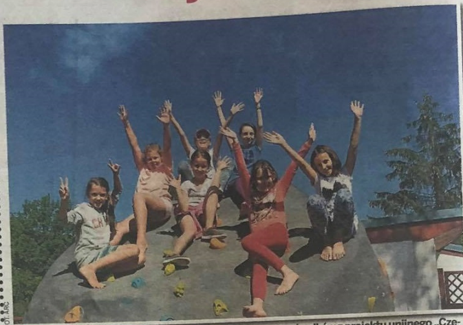
Miasto przygotowało program, który będzie finansowany ze środków z projektu unijnego „Częstochowa silna dzielnicami”. Projekt obejmie 500 dzieci

CZĘSTOCHOWA Bartłomiej Romanek b.romanek@dz.c.om.pl