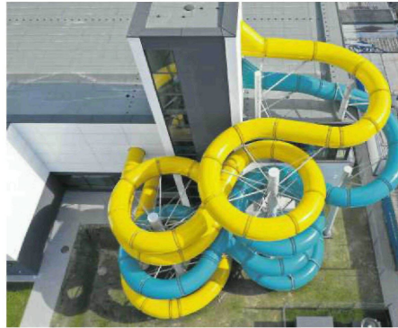
• Zjeżdżalnie w aquaparku przy ul. Dekabrystów