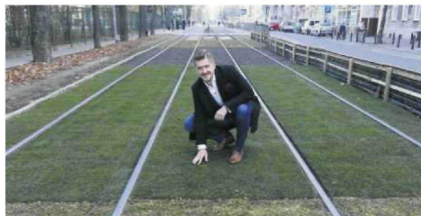
Różne rodzaje zielonych torowisk – z trawą i rozchodnikiem – testowane w Warszawie.

Teraz konsorcjum przygotowuje się do wejścia na ostatni i najtrudniejszy odcinek od al. Jana Pawła II do ronda Mickiewicza. Jak informuje NDI, część odcinków jest podzielona na pododcinki, dla których wyko-