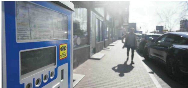
• Kierowcy muszą się przyzwyczaić, że zajmowanie przestrzeni publicznej kosztuje

Przywrócenie opłat zbiegło się z ich podwyżką z 2 na 3 zł za godzinę postoj. W innych miastach bywa jednak jeszcze drożej, np. 7 zł w Poznaniu.