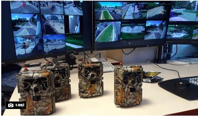
Fotopułapki (Straż miejska Częstochowa)

Częstochowska straż miejska otrzymała od Centrum Usług Komunalnych pięć specjalistycznych fotopułapek. Urządzenia posłużą do monitorowania miejsc nielegalnego składowania odpadów.