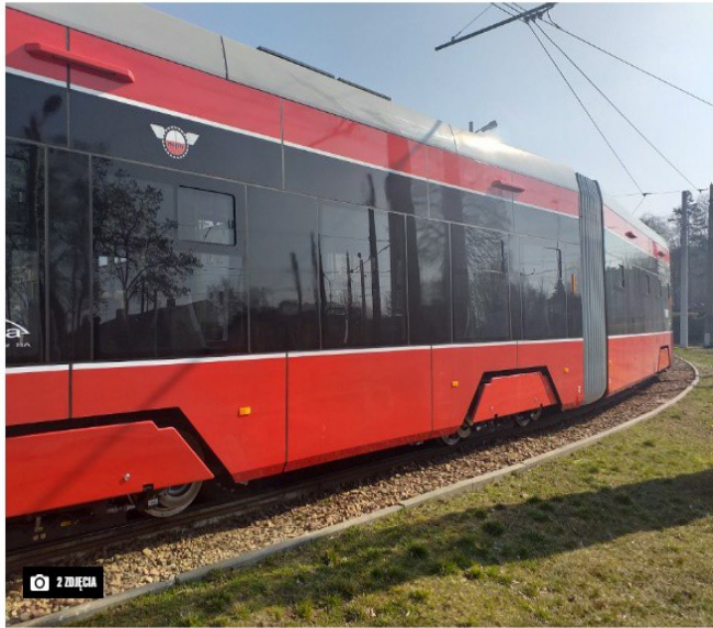
Drugi z 10 zamówionych tramwajów Twist

MPK w Częstochowie ma już drugiego twista nowej generacji. Producent, bydgoska Pesa, zapowiada, że za kilka dni dostarczy do Częstochowy trzeci tramwaj.