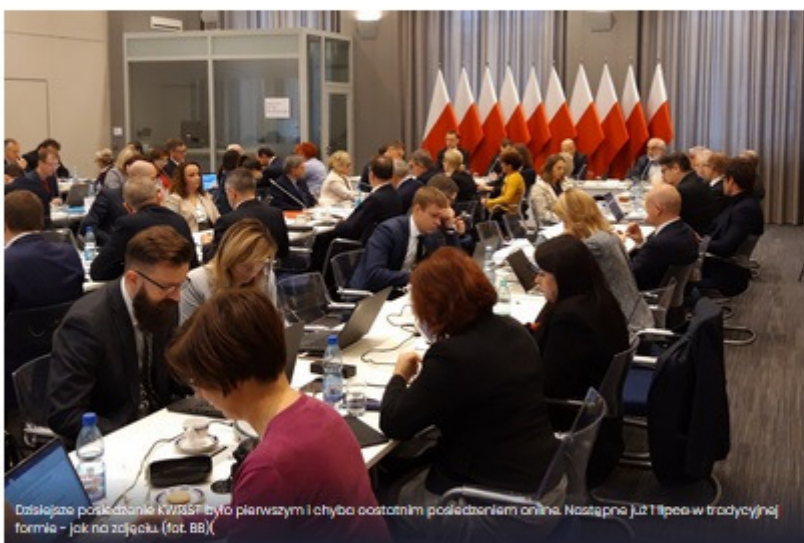
Dzisiejsze posiedzenie KWBSF było pierwszym i chyba ostatnim posiedzeniem online. Następnie już tylko w tradycyjnej formie – jak na zdjęciu.

Kredyty zaciągnięte w tym roku na uzupełnienie ubytków budżetu, a nie tylko na przeciwdziałanie epidemii koronawirusa, nie będą zaliczane do wskaźnika zadłużenia. Natomiast od 1 stycznia 2021 r. do wydatków bieżących nie będzie już zaliczana obsługa zadłużenia – te dwie najważniejsze zmiany w ustawie o finansach publicznych mają postawić budżety samorządowe na nogach i uwolnić procesy inwestycyjne. Strona samorządowa jest zadowolona z rozwiązań, które znalazły się w Tarczy 4.0, ale zamierza jeszcze powalczyć o odroczenie janosikowego.