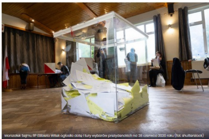
Marszałek Sejmiku RP Elżbieta Witek ogłosiła datę i tury wyborów prezydenckich na 28 czerwca 2020 roku

Gmina będzie musiała udostępnić pracownikowi Krajowego Biura Wyborczego dokumenty dotyczące zgłoszeń zamiaru głosowania korespondencyjnego oraz przekazania wyborcy pakietu wyborczego. Przewiduje to rozporządzenie Ministerstwa Spraw Wewnętrznych i Administracji, którego projekt dziś opublikowano.