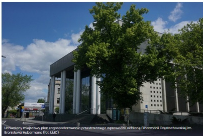
Uchwalony miejscowy plan zagospodarowania przestrzennego wprowadza ochronę Filharmonii Częstochowskiej im. Bronisława Hubermana

Radni uchwalili miejscowy plan zagospodarowania przestrzennego obejmujący obszar w rejonie Alei Najświętszej Maryi Panny oraz ulic Wilsona i Warszawskiej. Specjalny status w nim zyskuje budynek Filharmonii Częstochowskiej.