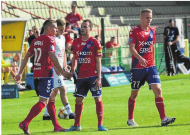
Raków w Bełchatowie gra od początku obecnego sezonu